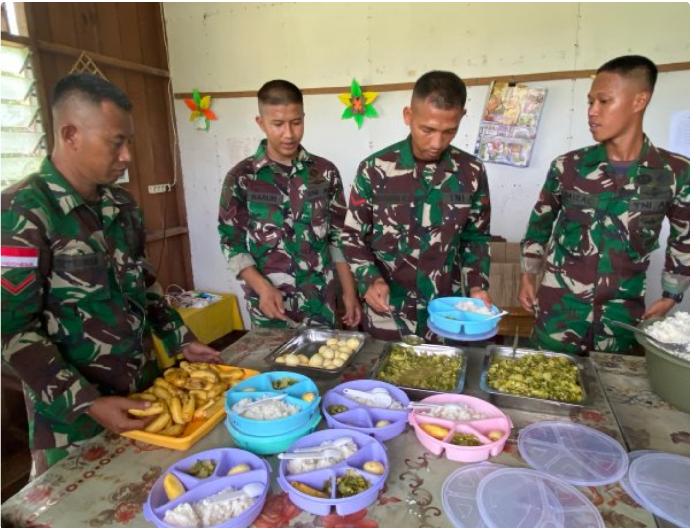
Foto: Dedikasi Satgas Pamtas Mobile RI-PNG Yonif 503/Mayangkara dalam mendukung program makan bergizi gratis pemerintah mendapat apresiasi tinggi dari masyarakat Distrik Krepkuri, Kabupaten Nduga, Papua, di sekolah rimba, Rabu (29/01/2025).

NDUGA- Dedikasi Satgas Pamtas Mobile RI-PNG Yonif 503/Mayangkara dalam mendukung program makan bergizi gratis pemerintah mendapat apresiasi tinggi